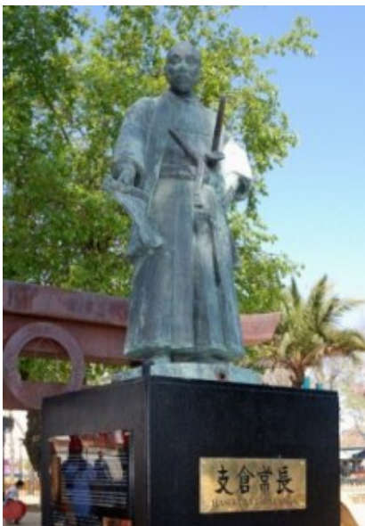
Estatua de Hasekura en Coria del Río